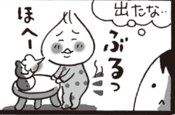
いまい ゆみこ NO.134